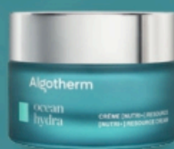
[Nutri+] Resource Cream 50 mL | €55

Az OCEAN HYDRA termékek használatára bőrápoló terapeutáinknak a kliens egyéni bőr diagnózisának függvényében kerül sor arckezelések során. Emellett része a szakértői Ocean Origins kezeléseknek és a magas technológiájú Ocean Tech kezeléseknek.